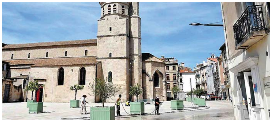
■ L'agression s'est passée sur la place Madeleine, en centre-ville, à la terrasse d'un café.

Incident. Les trois suspects ont été interpellés dans la soirée de mardi à Béziers.